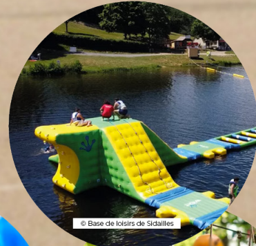
© Base de loisirs de Sidailles